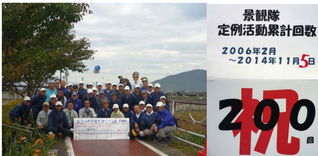
200回記念の定例活動に集まったメンバー